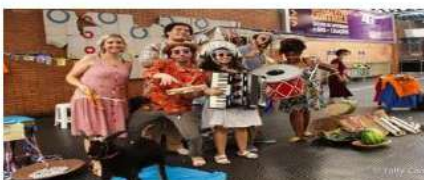
A atração mistura música e "causos".

A estação São Caetano da Linha Turquesa irá receber gratuitamente o espetáculo "A feira de Chico, Gonzaga e Jackson" nesta quinta-feira (05/05) às 15h. A atração é uma mistura de baile e teatro, com inspiração nas obras de Luiz Gonzaga, do dramaturgo Chico de Assis e Jackson do Pandeiro. Pela estação estará disponível causos nordestinos do dramaturgo Chico de Assis, e também causos de Luiz