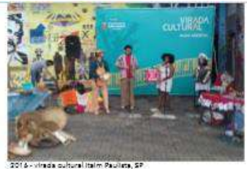
2014 - Virada Cultural Itaém Paulista, SP