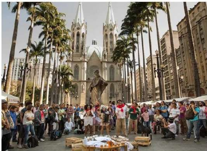
Um dos espetáculos reproduz uma feira nordestina

Em homenagem ao Dia Nacional do Teatro, comemorado na próxima segunda, dia 19, a Globo promove apresentações gratuitas de diversas linguagens teatrais na estação Osasco, da CPTM, e no calçadão Antônio Agu em mais uma edição do Arte na Rua . O teatro de mamulengos, um tipo de fantoche típico do Nordeste brasileiro, é uma das atrações.