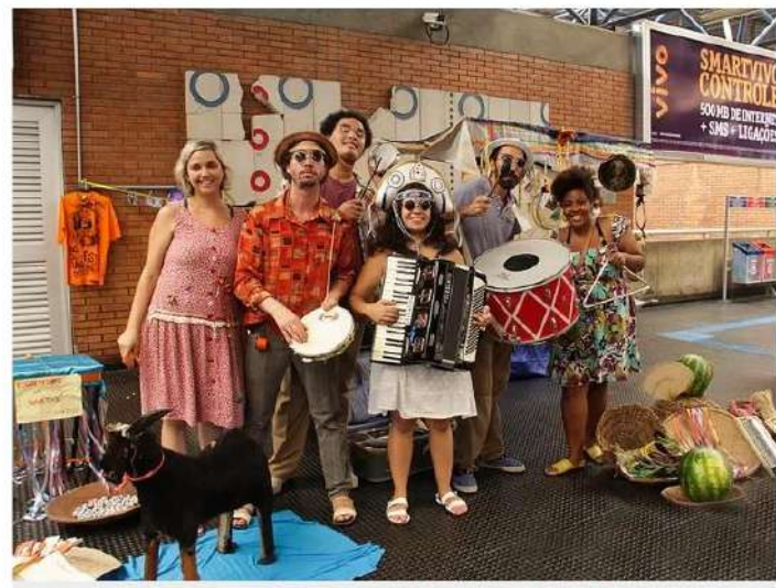
História se passa em feira e atores-feirantes contam suas histórias para o público.

O espetáculo 'A Feira de Chico, Gonzaga e Jackson' será apresentado nesta quinta-feira (26) às 15h, na Estação de Ferraz de Vasconcelos. A peça, que se passa em uma feira, é inspirada na obra de Chico de Assis e dos cantores e compositores Luiz Gonzaga e Jackson do Pandeiro.