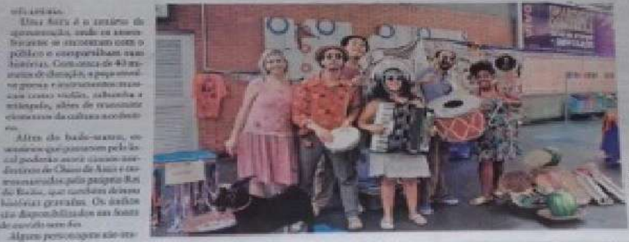
ESPETÁCULO Música, dança e culinária para homenagear três artistas populares